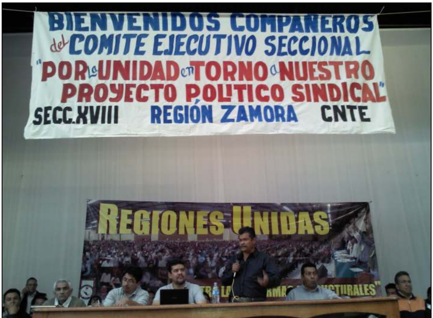
Asamblea Masiva Región Zamora.

los más recientes acuerdos que la Sección XVIII ha tenido con autoridades federales del ISSSTE en beneficio de la derechohabencia de nuestro estado; del mismo modo, se rememoró la participación de los maestros democráticos de Michoacán en las acciones a nivel nacional contra la reforma laboral, en los días previos a la aprobación de esta iniciativa lanzada por Felipe Calderón, entonces presidente del país, que lograron retrasar las deliberaciones legislativas y transformar tal iniciativa de preferente a ordinaria; la participación del secretario general en las asambleas de la CNTE en Zacatecas y Durango, y la organización y actividades que desarrolló nuestra Sección en el XI Congreso Político Nacional de la CNTE efectuado en Morelia, los pasados días 14, 15 y 16 de diciembre; en las acciones contra la imposición de la Reforma Laboral, se sometió a consideración de las asambleas respectivas su participación en la interposición de amparos indirectos contra esta medida, a lo que los asistentes respondieron afirmativamente para colaborar en esta acción concertada a