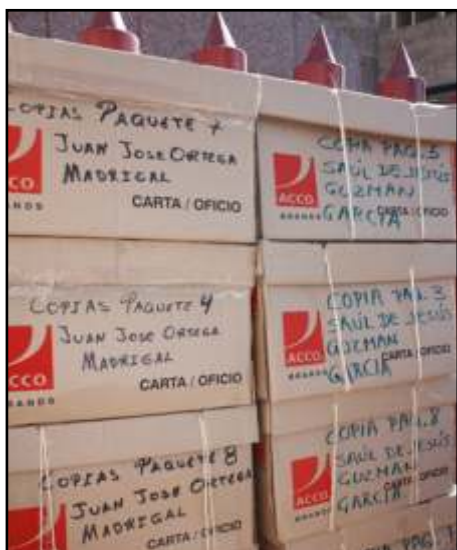
Cajas de expedientes del amparo contra la reforma laboral; Sección XVIII.

Periódico La Jornada Martes 15 de enero de 2013, p. 35