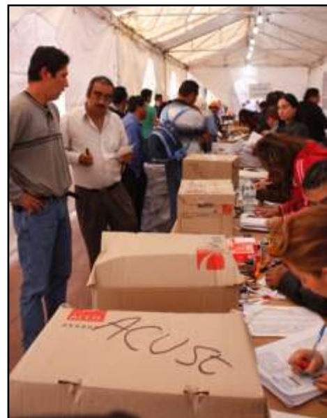
Mesas de trabajo en el interior del Poder Judicial de la Federación.

En una copia de la demanda de amparo entregada por la CNTE, los educadores señalan entre decenas de argumentaciones jurídicas que la nueva Ley Federal del Trabajo incluye la