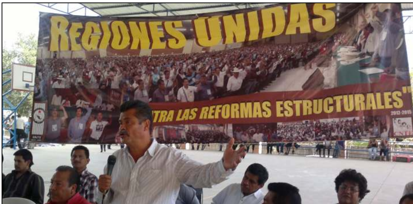
Asamblea Masiva Región Arteaga.

La Sección XVIII participará decididamente en la presentación de demandas de amparo contra la Reforma Laboral al lado de las secciones de la CNTE y de las organizaciones sociales del estado y del país: consenso de las Regiones de Arteaga, Los Reyes y Zamora.