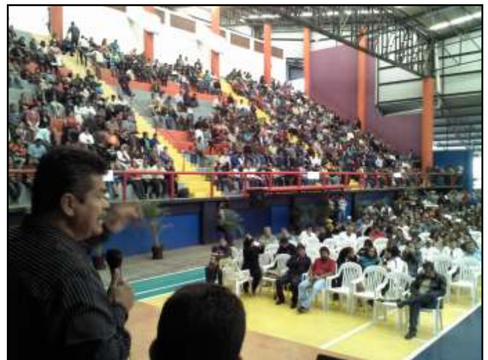
Asamblea Masiva Región Zamora.

Cada Asamblea Masiva eligió a sus respectivas coordinaciones regionales y al elemento que formará parte de la Comisión de Honor y Justicia de nuestra Sección XVIII. PdB