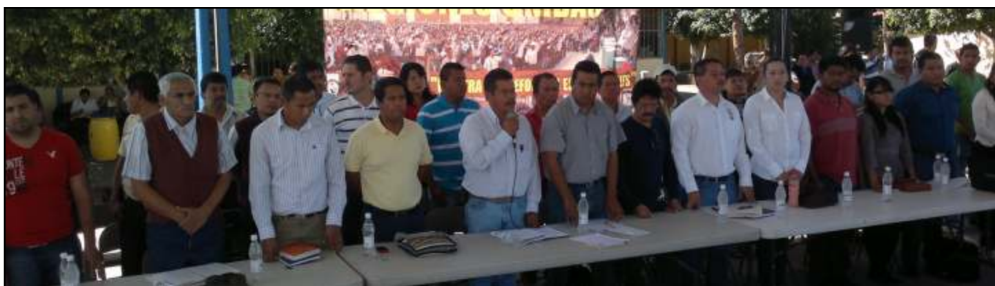
Asamblea Masiva Región Los Reyes.

En los eventos mencionados, también se dio informe sobre