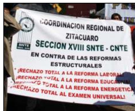
La Región Zitácuaro, presente.

subcontratación, lo cual implica la supresión de la bilateralidad en cuanto al ingreso y la negociación colectiva de las condiciones de trabajo, anulando en los hechos la revisión anual y bianual del contrato colectivo de trabajo, además de que pulveriza y fragmenta al sindicato, quitándole su materia de trabajo. PdB