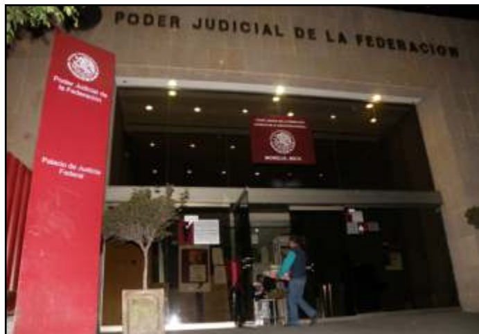
Última caja de amparos de maestros del Estado de Michoacán

Respecto a los cuestionamientos realizados por varios sectores sociales en los que se dice que el magisterio no es afectado con las modificaciones a la ley, el abogado detalló que la parte central del artículo 123 es el apartado A, mientras que nosotros