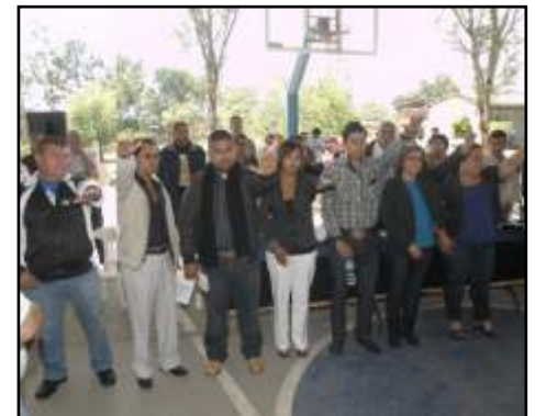
Toma de Protesta de Nuevos Delegados Región La Piedad.

En la orden del día se contempló la elección de la nueva Coordinación Regional misma que fue designada y, también, un miembro de esta Región para integrar la Comisión Sindical de Honor y Justicia. PdB