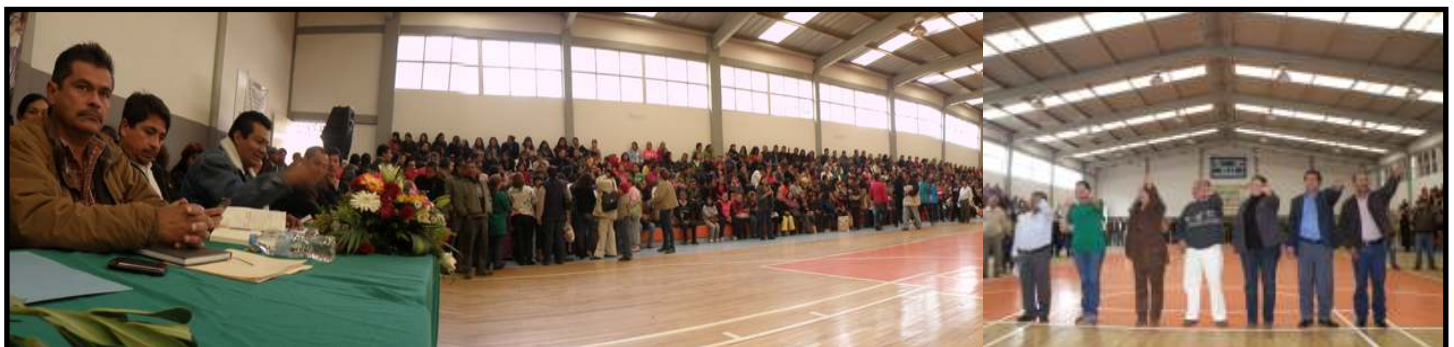
Toma de protesta los coordinadores elegidos con democracia, en la región de Pátzcuaro.

masiva planeada para el día 14 de diciembre, concluyó el mensaje del secretario general y se procedió a conformar lo que desde hoy es la nueva Coordinación general regional con lo que concluyó esta reunión docente en la Región Pátzcuaro. ■