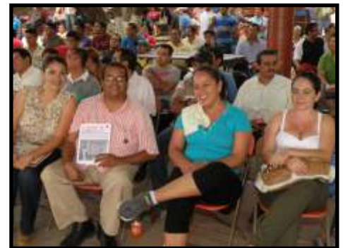
Maestros mostrando el Poder de Base, Región Huacana.

En la culminación de la Asamblea, luego de una ronda de participaciones por parte de los huacanenses para fijar sus posturas y opiniones en cuanto a la forma de elegir a sus representantes regionales, se procedió a la elección de los elementos que conformarán esta instancia desde hoy y hasta el año 2015 y, al mismo tiempo, se designó a quien representará a esta Región en la Comisión de Honor y Justicia que, como lo definió el VI Congreso Seccional de Bases, habrá de colaborar en los asuntos correspondientes a esa muy importante Comisión. BB