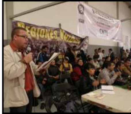
Asamblea Masiva Región Pátzcuaro.

octubre; la participación de la Sección XVIII en las movilizaciones nacionales contra la Reforma Laboral, al lado de las secciones que conforman la CNTE; el establecimiento de relaciones bilaterales entre el gobierno del estado y la Sección XVIII; las negociaciones con autoridades federales y estatales del ISSSTE; y la necesidad de emprender la lucha jurídica, por medio de un amparo, contra la recientemente aprobada Ley Federal del Trabajo.