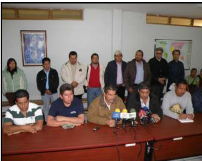
Rueda de Prensa de la CNTE.

Previo a la instalación del Congreso, los maestros democráticos protagonizaron una marcha estatal masiva en Morelia, con la cual también demandan al Gobierno del Estado, el pago de los adeudos que se tienen con miles de trabajadores desde hace más de un año, así como algunos otros pendientes minutados. RE