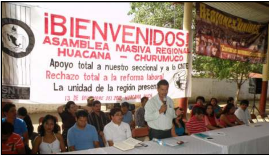
Nuevos Coordinadores Región Huacana.