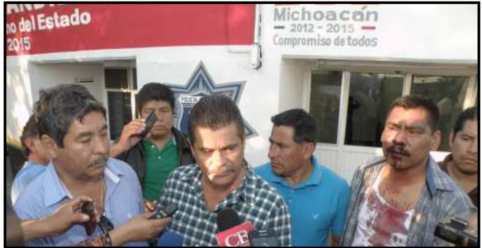
Afuera de Barandilla.