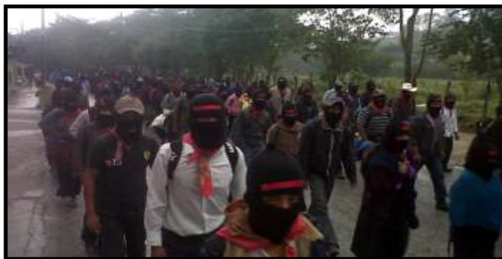
23 Diciembre, 2012 - 20:40.

La expectativa ante el anuncio de un pronunciamiento de la Comandancia General del EZLN ha avivado a los movimientos que siguen el ideal de “abajo y a la izquierda”.