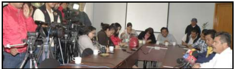
Rueda de prensa: La Reforma Laboral.

En otro orden de ideas, el sindicalista se manifestó en contra del recorte presupuestal a educación, pues, dijo, 9 mil 532 millones de pesos es un retroceso grave, "vemos preocupante que ese recorte es a educación básica, una reforma con este tipo de recorte no considera aspectos como infraestructura, equipo, construcción y nuevas plazas, que son importantes para el sector, por lo que este movimiento tomará sus precauciones y estará al pendiente de qué se tiene que realizar en el estado y en el país".