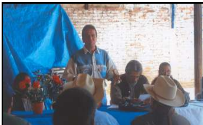
Durante el Nombramiento de DS. DV-24 Uruapan.

Conscientes todos que nuestro sector (al igual que otros) tiene múltiples necesidades, se tendrá que luchar por ellas emprendiendo todas aquellas