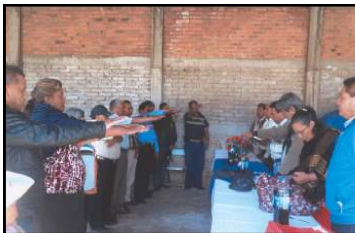
Nueva Delegación Sindical DV-24 Uruapan, en toma de protesta.

UNIDOS Y ORGANIZADOS: VENCEREMOS FRATERNALMENTE SECRETARÍA DE JUBILADOS Y PENSIONADOS DE LA SECCIÓN XVIII, MICHOCÁN SECTOR IV, MICHOCÁN ¡DEJAR DE LUCHAR, ES COMENZAR MORIR!