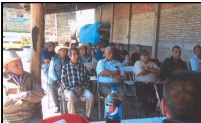
Asistentes al nombramiento de DS. DV-24 Uruapan.