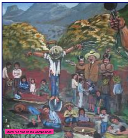
Mural "La Voz de los Campesinos"