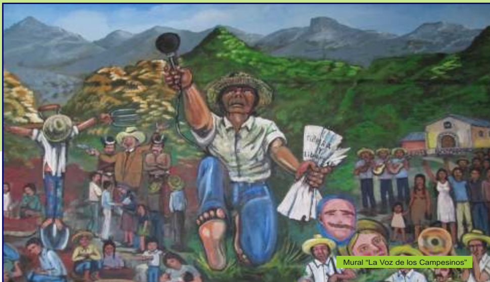
Mural "La Voz de los Campesinos"

"POR EL DERECHO DE TODOS LOS PUEBLOS A COMUNICARNOS"