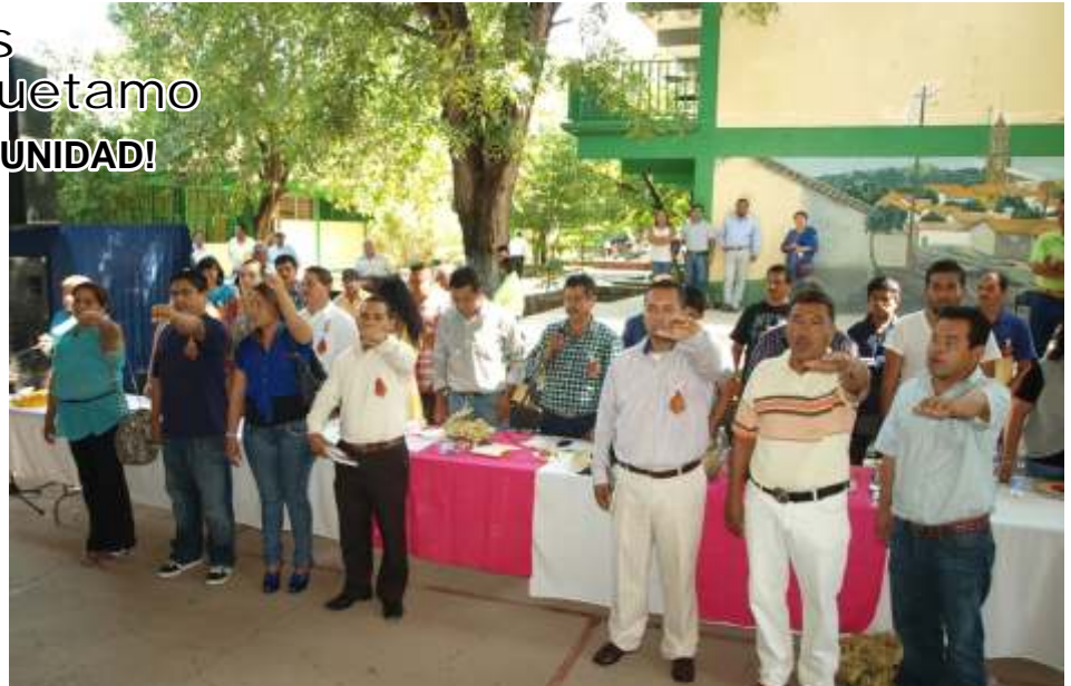
Nueva Italia: Nuevos delegados en toma de protesta

Además, se abordó lo referente a una mesa de trabajo con funcionarios del ISSSTE realizada en la ciudad de México, en el marco de la movilización nacional contra la Reforma Laboral, “en la que se reconoce la relación bilateral y se da el peso específico, legítimo y legal que nuestra Sección XVIII tiene. En esa ocasión se lograron grandes avances en tres puntos