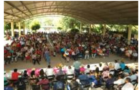
Cerca de 1500 trabajadores de la educación en la Reunión Masiva de Región Huetamo.

Por otra parte, el dirigente reiteró el compromiso de respetar lo mandatado por el VI Congreso Seccional de Bases, acerca de trabajar por la UNIDAD, que