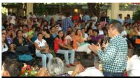
Masiva: Huetamo, Mich.

Además de que también se nombró a la nueva Coordinación Regional y se nombró a un elemento de esta Región Huetamo para formar parte de la Comisión de Honor y Justicia quien, sin ser liberado de su responsabilidad escolar, acudirá a sesionar con los demás miembros de esta muy importante Comisión. PH