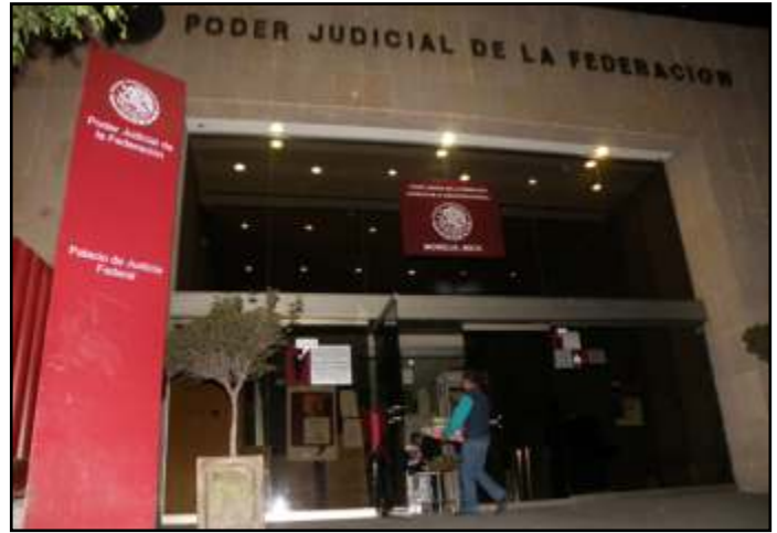
Última caja de amparos de maestros del Estado de Michoacán

Respecto a los cuestionamientos realizados por varios sectores sociales en los que se dice que el magisterio no es afectado con las modificaciones a la ley, el abogado detalló que la parte central del artículo 123 es el apartado A, mientras que nosotros