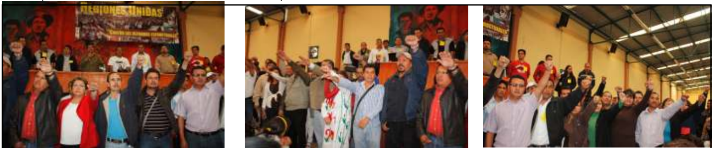
Toma de Protesta, de los nuevos electos de Región Morelia

arrebatarlos la plaza base y nuestras conquistas laborales, que busca la precarización salarial, la contratación a través de terceros y la sobreexplotación".