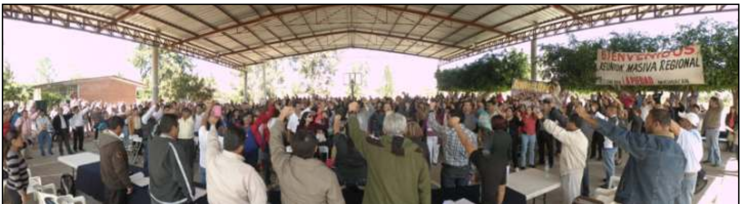
Cientos de maestros, Luchar vencer, el pueblo al poder...