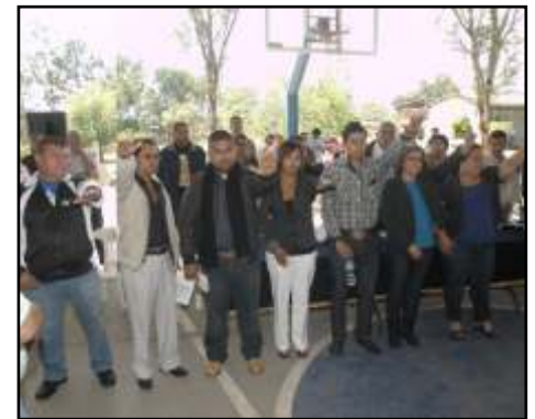
Toma de Protesta de Nuevos Delegados Región La Piedad.

En la orden del día se contempló la elección de la nueva Coordinación Regional misma que fue designada y, también, un miembro de esta Región para integrar la Comisión Sindical de Honor y Justicia. PdB