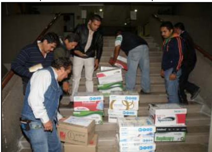
El amparo contra la Reforma Laboral el día 15 de enero antes de las 12 de la noche.

Finalmente, señaló que pese a que los amparos se pueden promover en toda la República en los Juzgados de Distrito en los estados, todos se están concentrando en Juzgados de Distrito Auxiliares, que son los únicos que resolverán en la Ciudad de México, “esto con el fin de uniformar criterios y evitar que algunos jueces concedan una cosas y otros tras”.