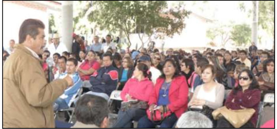
Reunión Masiva Regional, la Piedad.

Del mismo modo, hizo mención de los trabajos y acciones que este seccional ha emprendido desde su elección en octubre del año pasado con las muestras de solidaridad hacia los normalistas de Michoacán, reprimidos por el gobierno, en su pugna por un normalismo crítico y de servicio al pueblo; los logros ante las autoridades federales y estatales del ISSSTE; el reconocimiento hacia este CES de parte del Ejecutivo michoacano como representación legítima del magisterio estatal; los aportes que el magisterio de