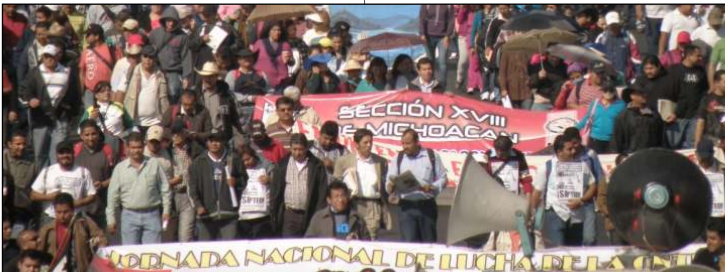
Miles de maestros rumbo a la cámara de Diputados en defensa de la educación pública.

También informó que en esta semana saldrá la convocatoria