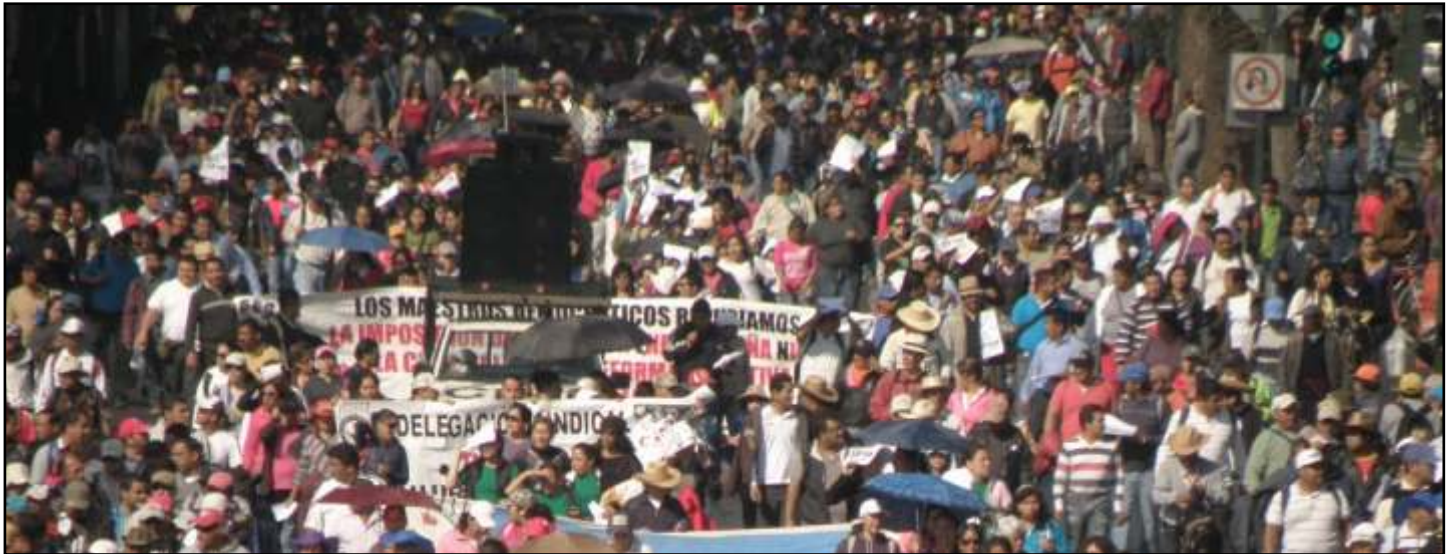
Miles de maestros rumbo a la cámara de Diputados en defensa de la educación pública.

para el Congreso Nacional de Educación, “vamos a grandes foros regionales en todo el país, y el 25, 26 y 27 de abril realizaremos el Congreso”.