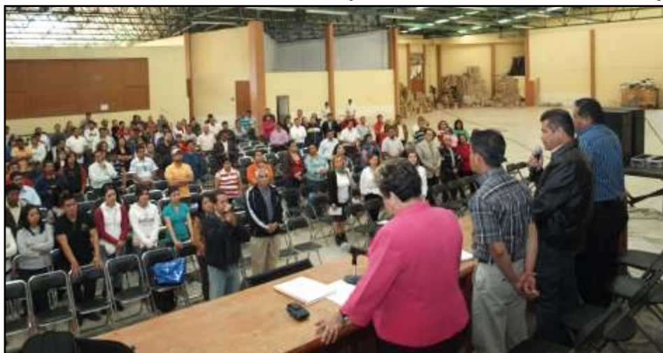
Pleno de Sec. Grales, Técnicas y Telesecundarias.

Por lo anterior, llamó a todos los compañeros a organizarse y discutir, a través de la jornada de lucha pedagógica, cómo vamos a innovar y cómo dejaremos de ser predecibles, mediante una jornada pedagógica que iniciará con nuestro Congreso Estatal de Educación y Cultura, con el que juntos construiremos las iniciativas y