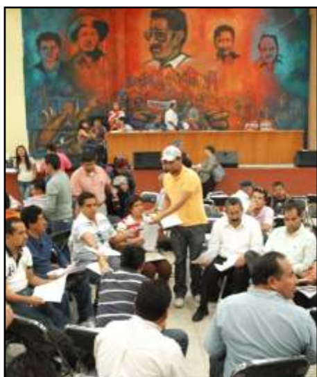
Mesas de análisis de la reforma, educativa.

embestida encabezada por Enrique Peña Nieto obliga al magisterio a buscar nuevas formas de lucha que den la condición, no solo de resistir, sino de ir más allá de los intentos de este gobierno por arrancarnos el derecho universal a un trabajo y salario digno que garantice las necesidades de nuestra familia.