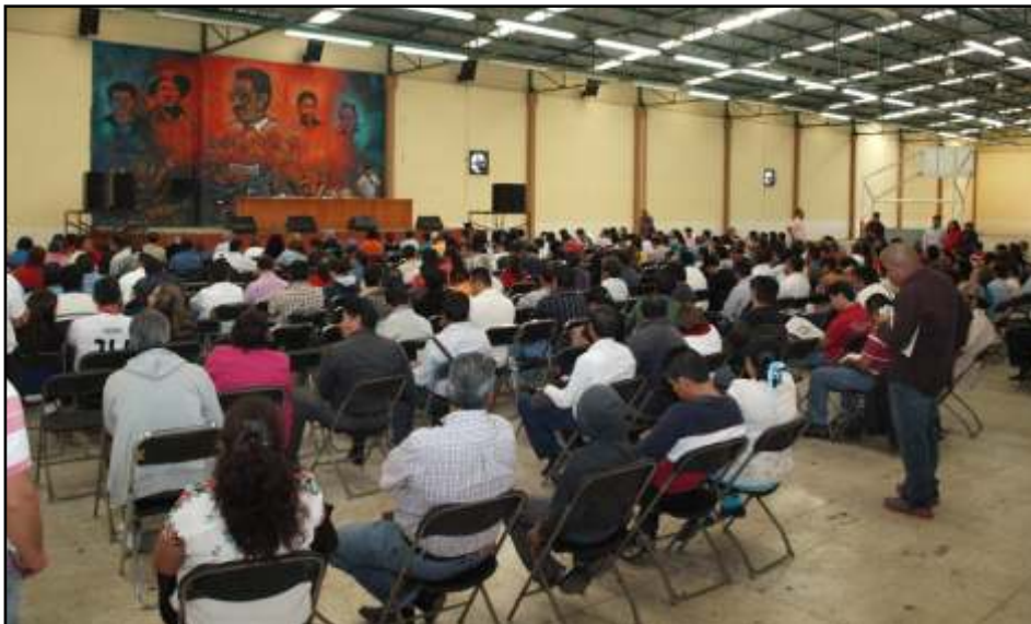
Pleno de análisis de los niveles de CAPEP, Preescolar, Especial e Inicial.

propuestas de cada nivel para llevarlas a la contienda que vamos a iniciar la próxima semana con una convocatoria oficial en donde la SEE y nosotros seremos convocantes, "para ello necesitamos apropiarnos de todo el proceso y que mejor que con ustedes, los verdaderos interesados en fortalecer la educación pública".