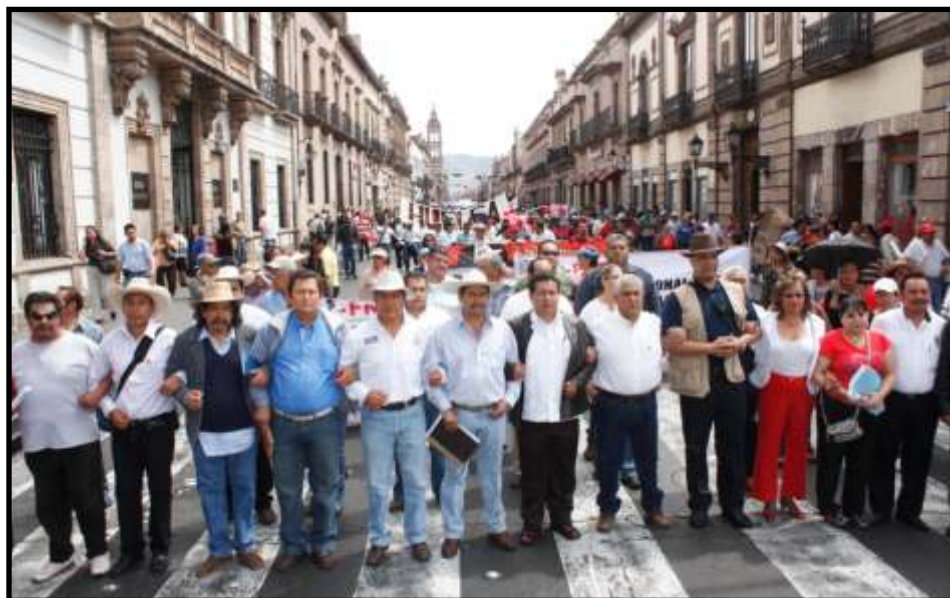
Al frente dirigentes de diferentes sindicatos ATEM, SEUM

Y respecto al paro de labores, señaló que Michoacán ya está en posibilidades de estallar, sin embargo, la CNTE ha acordado el estallamiento de las