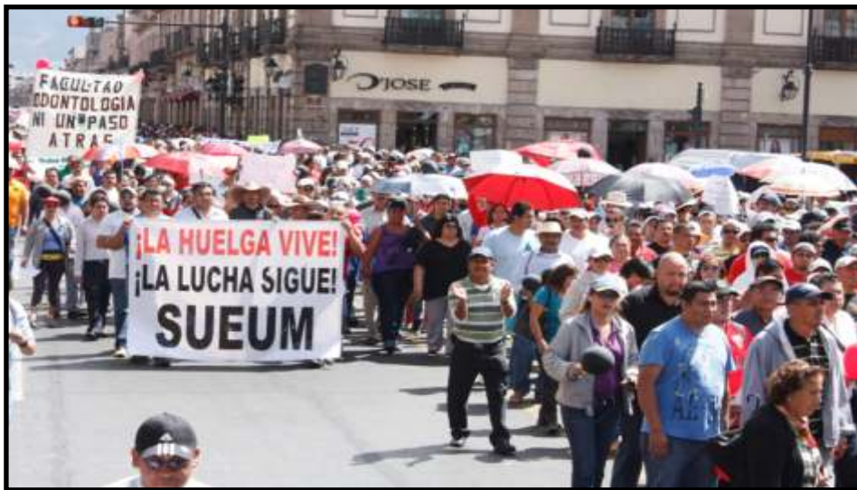
Maestros en marcha por Av. Madero en solidaridad con el SUEUM

proyecto educativo a aplicarse en el estado.