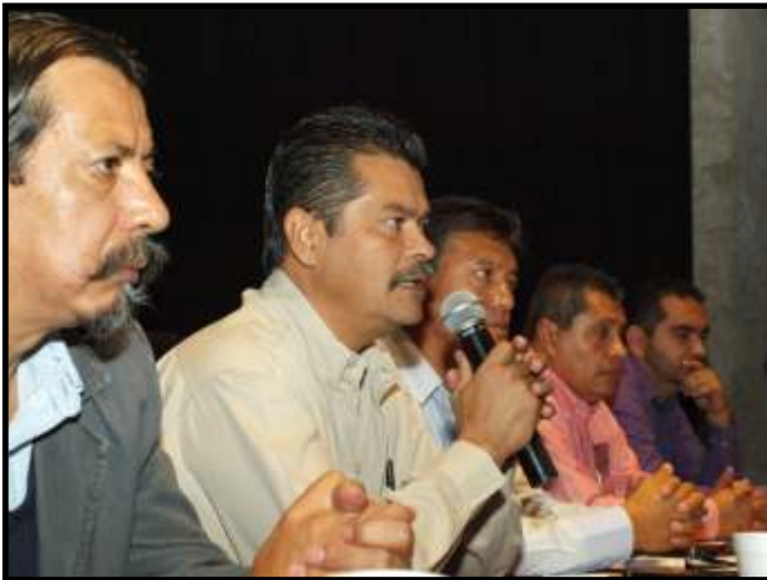
Sec. Gral de la Secc. XVIII, dando a conocer Marcha masiva de los cuatro puntos de la capital del estado de Michoacán[2]

el Diario Oficial de la Federación en diciembre pasado y que prohíbe la celebración de minutas o convenios con organizaciones sindicales en las que se comprometan recursos económicos extras a las prestaciones y salarios ya otorgados.