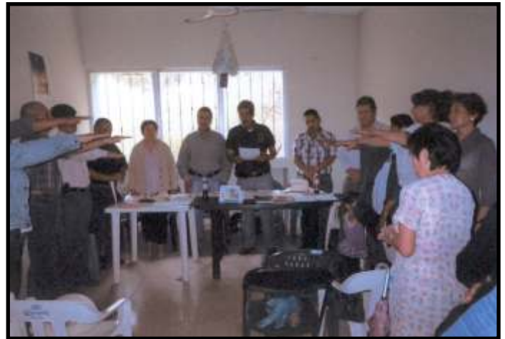
Toma de Protesta de la nueva Coordinación General DIV-16, Los Reyes, Mich.

SECRETARÍA DE JUBILADOS Y PENSIONADOS DE LA SECCIÓN XVIII DEL SNTE, MICHOACÁN.