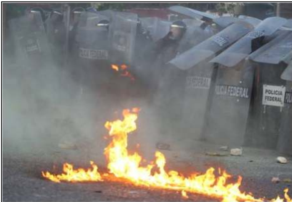
Profesores de escuelas públicas de Guerrero, al ser desalojados de la Autopista del Sol por elementos de la Policía Federal.

Destacaron que no serán sus advertencias las que definan la agenda de lucha de la coordinadora ni la toma de decisiones del magisterio disidente. PdB