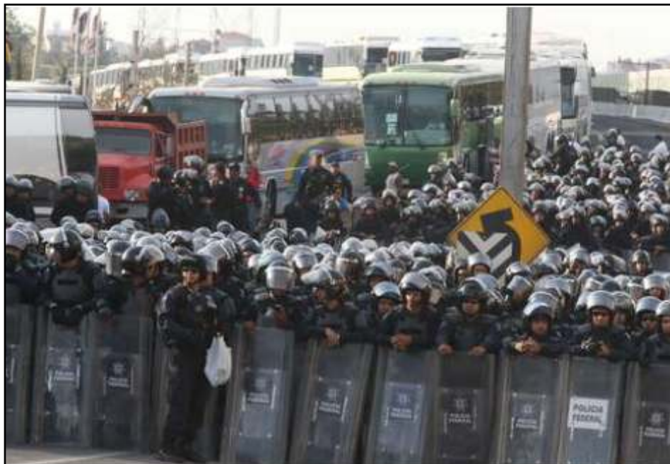
Elementos de la Policía Federal antes del enfrentamiento con maestros de la CETEG en la avenida René Juárez Cisneros, en Chilpancingo, Guerrero.