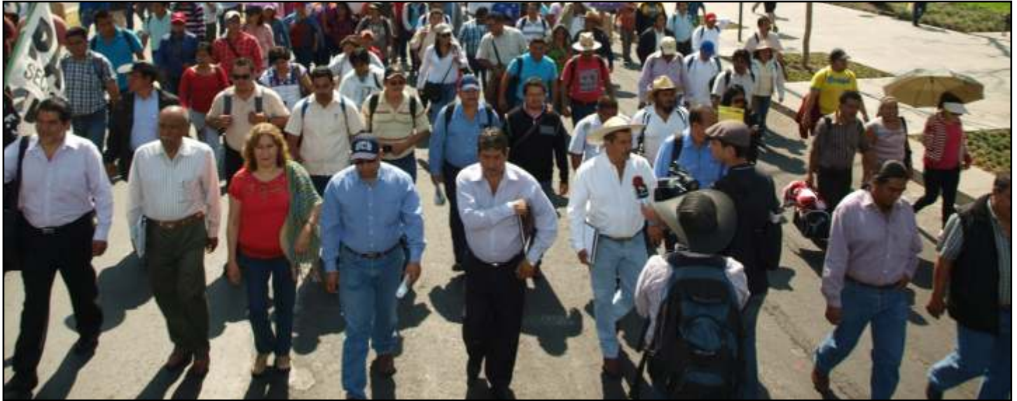
Cerca de 18 Estados de la República en marcha hacia las oficinas de gobernación en el D.F.

“No es una negativa a mejorar la calidad de la educación, pero no vamos a aceptar que se limite a una reforma administrativa que lesiona la escuela pública”, dicen los dirigentes magisteriales.