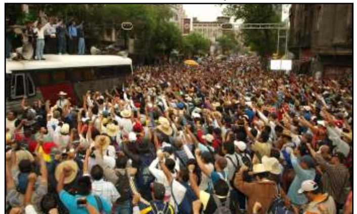
Miles de maestros a las afueras de las oficinas de Gobernación