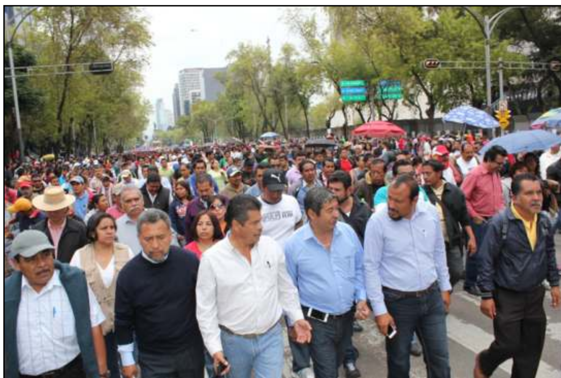
Dirigentes de diferentes Secc. IX, XVIII, XXII, etc, rumbo a gobernación en el D.F