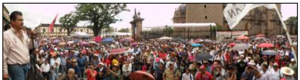
JJOM, nuestro apoyo para los compañeros con alimento cobijas y ropa

Así mismo, señaló que llamarán a todas las secciones de la Coordinadora Nacional de Trabajadores de la