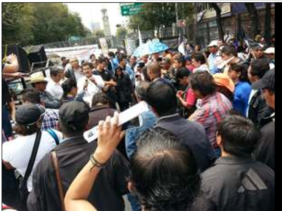
(En la fotografía se muestra al Secretario General de la Sección XVIII de la CNTE-SNTE dando la información después de la recepción de la comisión por parte de los funcionarios de la SEGOB)

Aproximadamente a las 11:30 hrs fue recibida la CNUN de la CNTE donde los planteamientos centrales lograron hacerse. La fecha para reinstalar los trabajos que se venían sosteniendo entre los contingentes de la CNTE organizados en la CNUN se acuerda y será el próximo jueves 18 de septiembre del 2014, con ello una vez más se da una muestra de la fuerza del movimiento organizado y unido que sostienen los docentes de México. A la salida de la reunión con los funcionarios de la Secretaría de Gobernación el Secretario General de la Sección XVIII brinda la información.