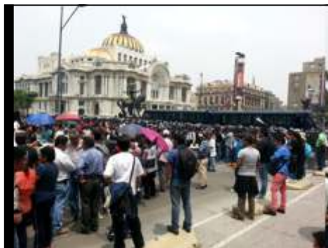
(El gobierno enfrenta pueblo con pueblo para que seamos nosotros los que nos acabemos golpeando; foto donde la valla de cuerpos federales obstruyen el paso de la CNTE).