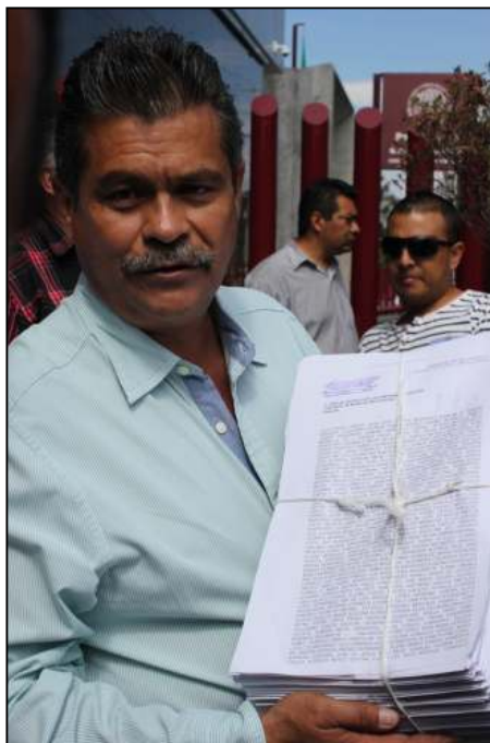
J.J.O.M., con la entrega ya sellada de recibido

Finalmente, confió en que los jueces y magistrados analicen de manera puntual los puntos planteados para que puedan dar solución a una demanda tan importante para el futuro de la educación y sus trabajadores en México.